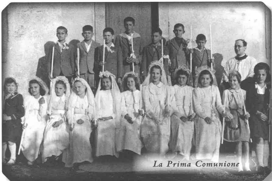
La Prima Comunione

Sclesis: Ducj a disin che prufitant de mê cariche di sindic o ài robât i bêgs dal popul. Us zuri che ta chistis sachetis nol è mai entrât un franc di faeur vie. Vôs dal popul: "Astu metût la mude gnove?"