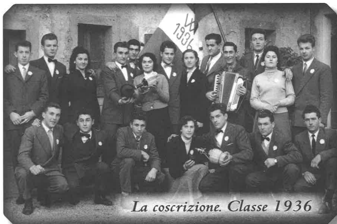
La coscrizione. Classe 1936