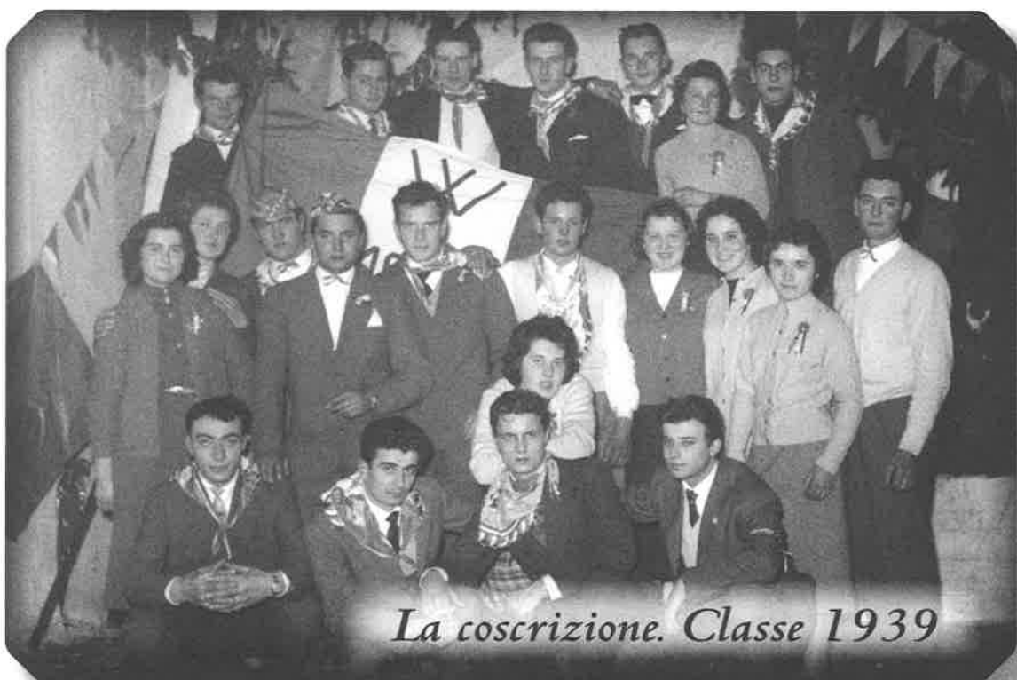
La coscrizione. Classe 1939