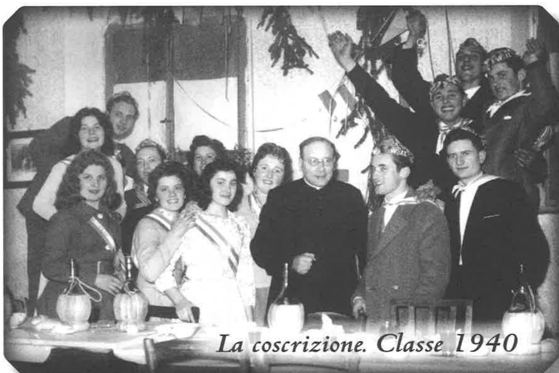
La coscrizione. Classe 1940