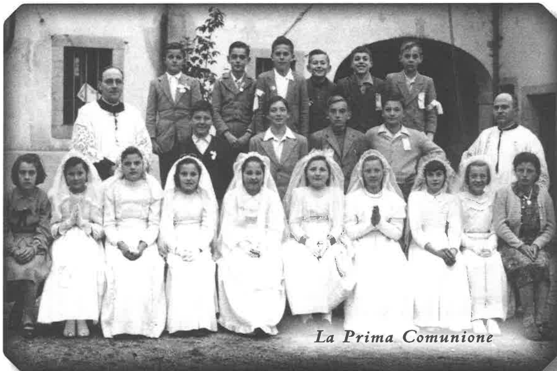
La Prima Comunione

Sclesis: J domandin: "Cemût fâtu dibessôl a fâti di mangjâ cumo che tu as la femine vie?" "Ma fin che lis gjalinis a fasin ûs, j fâs fertae, cuant che no'n' fâsin plui lis mangjarai. Ma o ài tignût un discôrs tal gjalinâr; cumò a san ce ch'o pensi e lôr ch'a stielzin pe miôr."