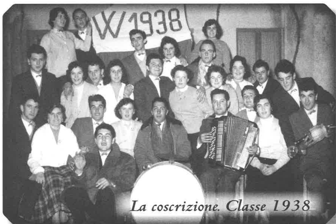
La coscrizione. Classe 1938