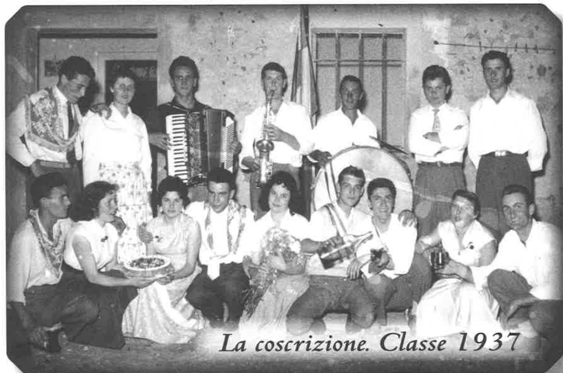
La coscrizione. Classe 1937