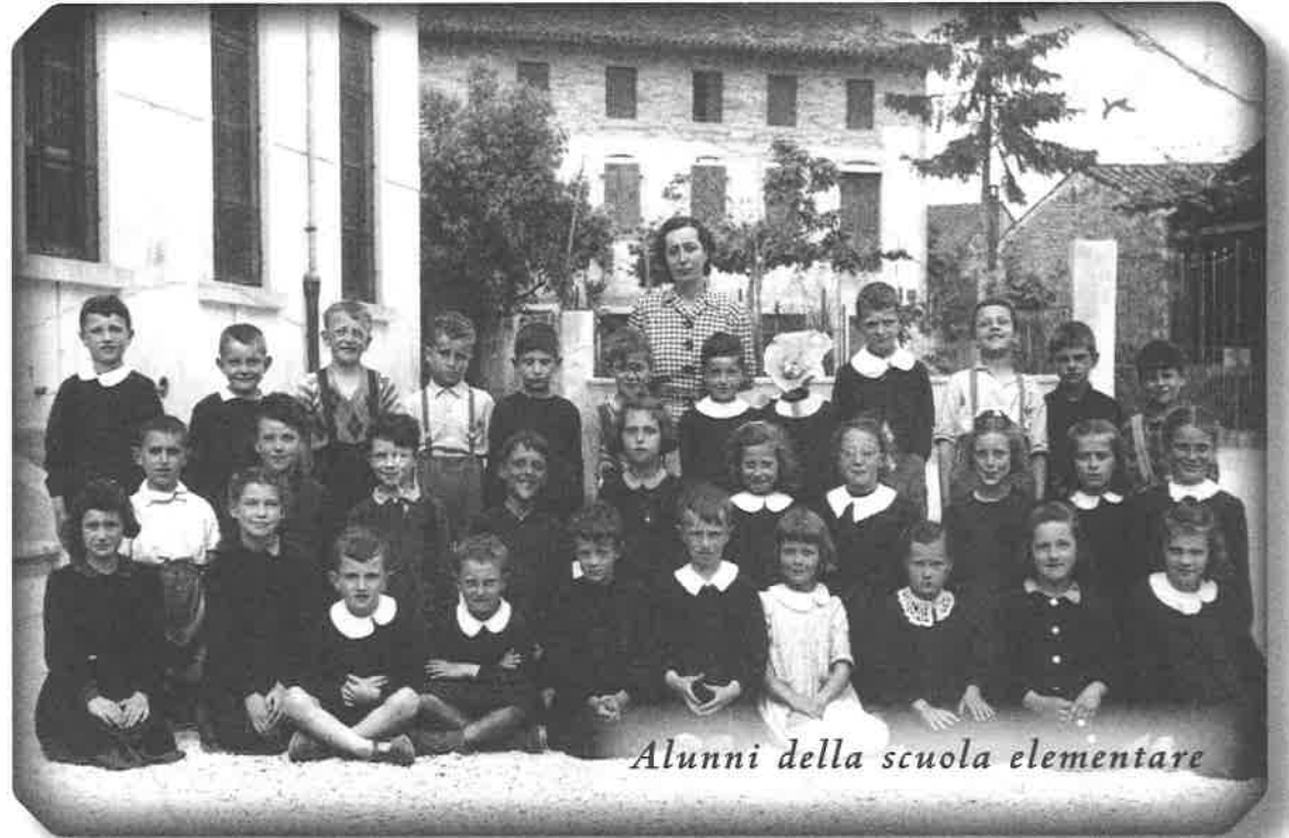
Alunni della scuola elementare

"Ce dovaressio di jo, comari, ch'a son ains che mi pâr di lâ a durmî cun tun caratel?"